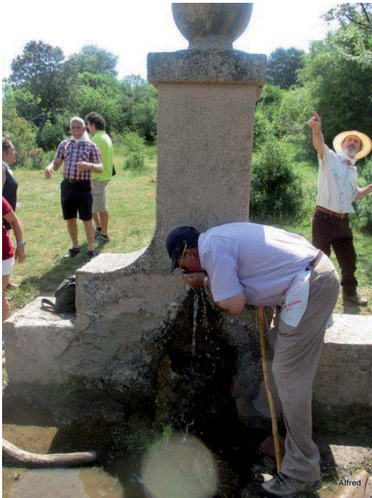
Fig. 9. Refreshándose en la fuente de los Barones.