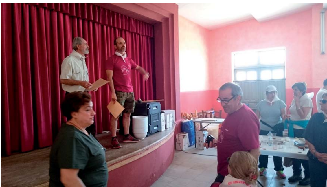
Fig. 14. Agradecimiento a los asistentes.