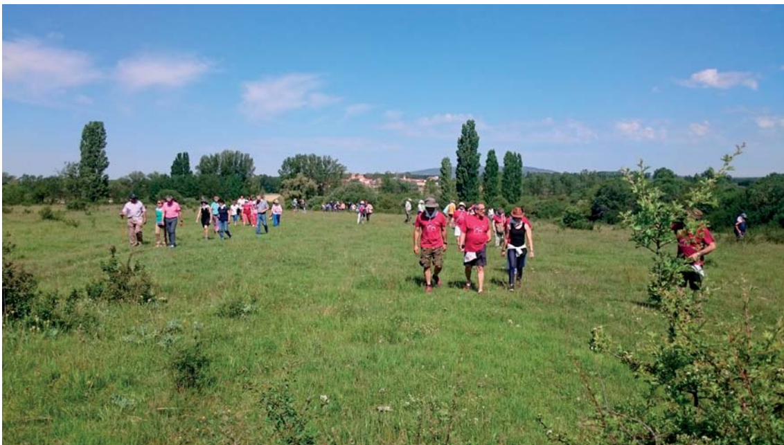
Fig. 8. Careo hacia los Barones.

poesía de la Universidad de León en su V edición con el libro titulado “De sueño en sueño”, quien nos deleitó con otra poesía de Machado.