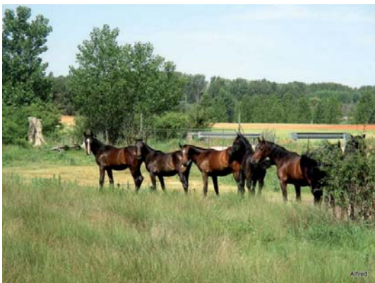
Fig. 10. Observando a los visitantes.

nigna que por donde quiera que vayas tendrás algo que imitar”.