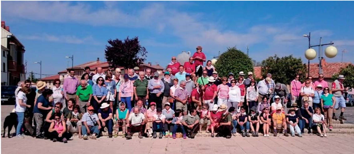
Fig. 2. Foto de grupo en la plaza de Quintana Redonda.