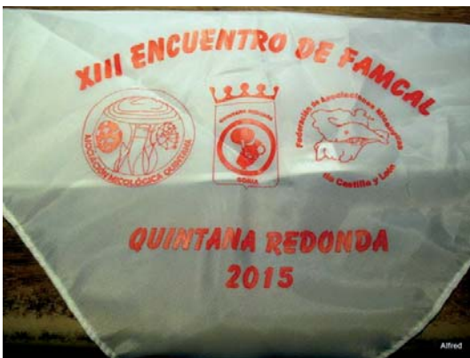
Fig. 3. Pañoleta conmemorativa.

plaza de Quintana donde cogimos los coches para ir a la villa romana de “La Dehesa”. La visita a la Villa Romana fue muy interesante y gustó mucho (Fig. 12).