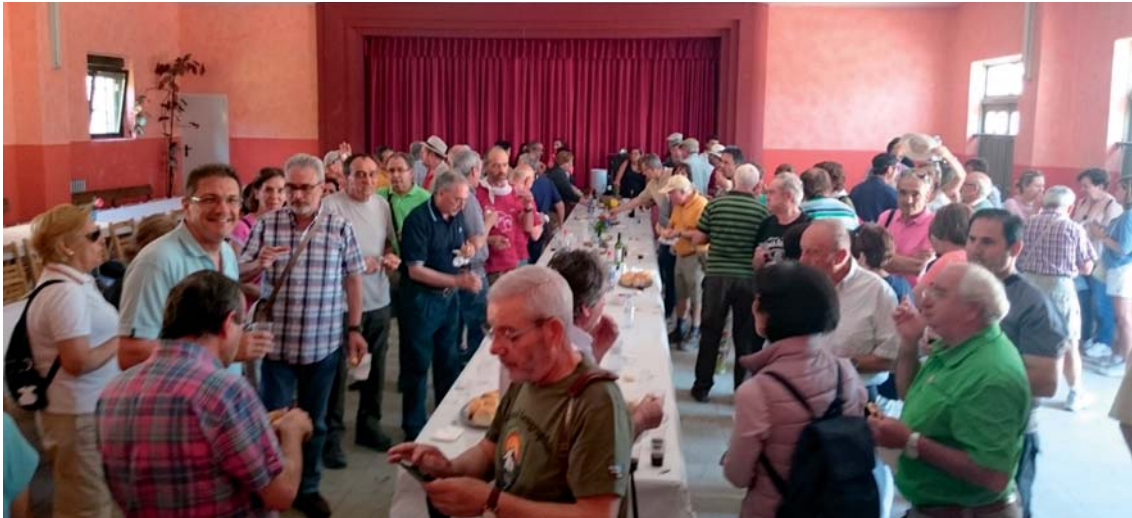
Fig. 5. Cogiendo fuerzas.