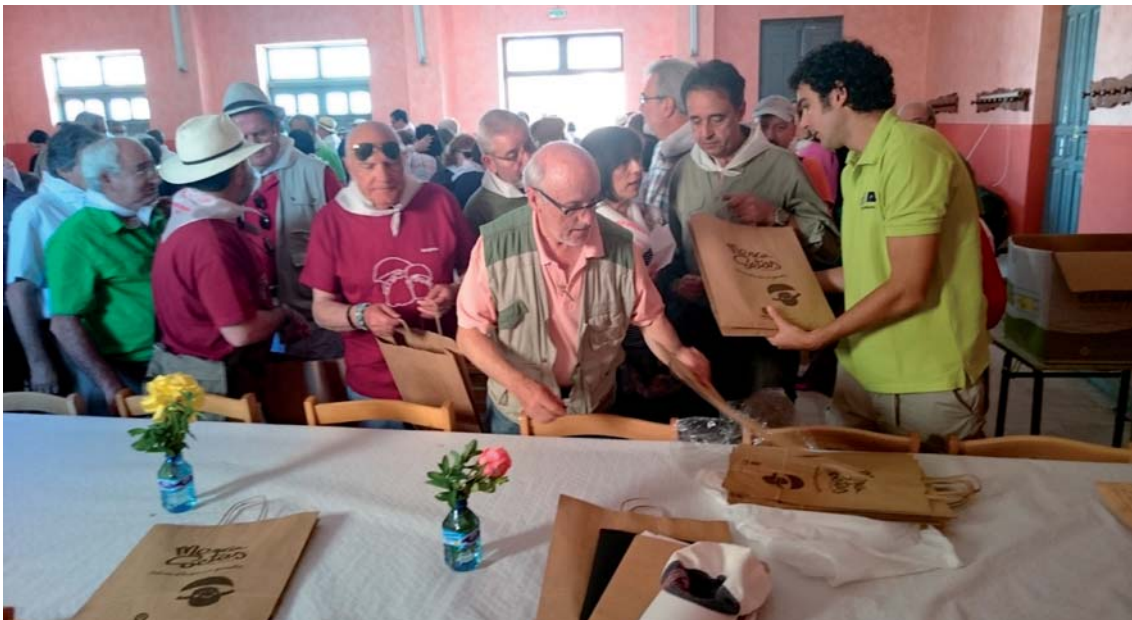
Fig. 4. Entrega de la bolsa Mercasetas con obsequios.

Fue en ese momento cuando nos enteramos de que alguien había perdido las llaves del coche en “La Dehesa”, y volvimos a ver si le encontrábamos a él, no a las llaves, cuya búsqueda se nos antojaba que era como buscar una aguja en un pajar. Pero no fue así, según me dijo una componente de la Asociación Micológica Leonesa San