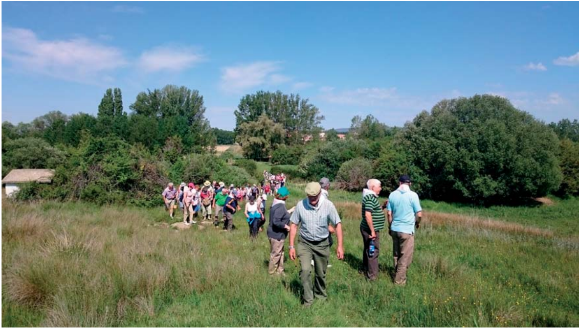
Fig. 7. Subida a la Llana.