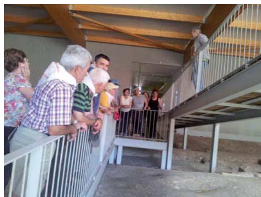
Fig. 12. Visita a la Villa Romana.

mos”; totalmente de acuerdo, este país necesita una gran reforestación, y añade: “Que solo una gran muralla verde podría paliar los efectos del cambio climático”. VALE.