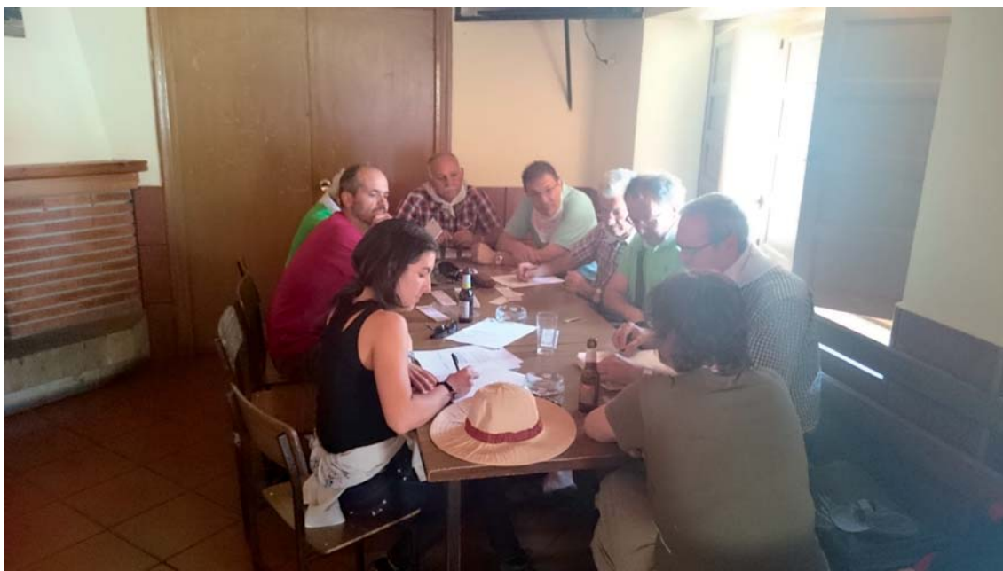
Fig. 13. Reunión de la Junta Directiva.